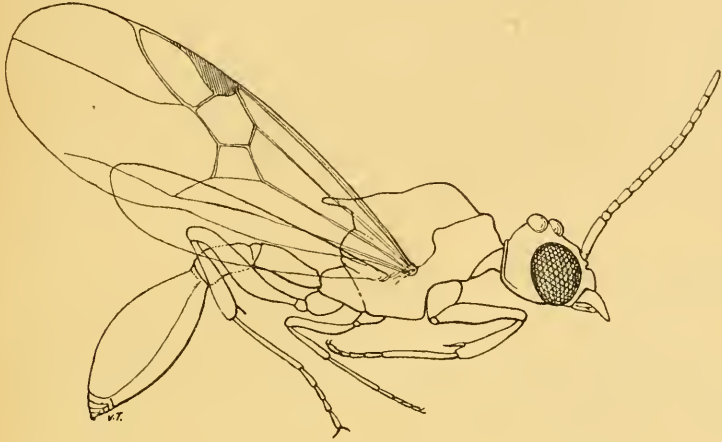
Atopomyrmer Foreli? ♂

descrivere. — Il capo è breve, con occhi enormi, più che emisferici, ritondato posteriormente, col foro occipitale largo e marginato, prolungato innanzi agli occhi in una sorta di muso. Le mandibole sono large, trigone, con 6 denti acuti, dei quali l'apicale più lungo. Clipeo grande, convesso, arcuato innanzi.